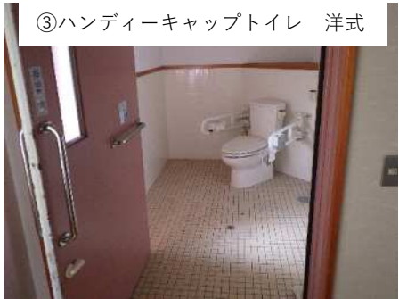
③ハンディーキャップトイレ 洋式