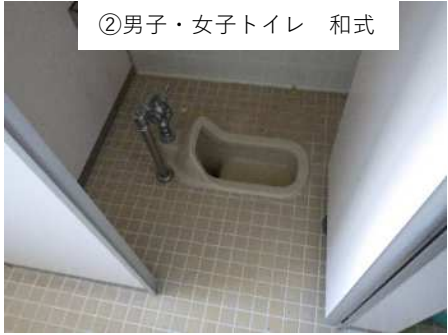
②男子・女子トイレ 和式