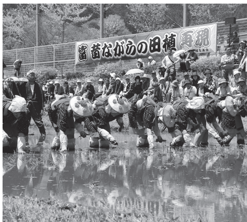
11:30 ~の昔ながらの田植え再現