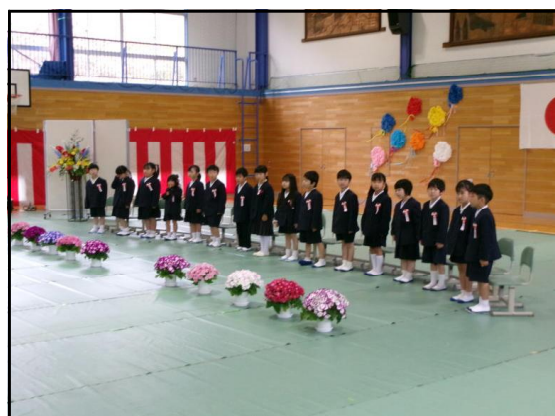
大きな声で上手に返事ができました