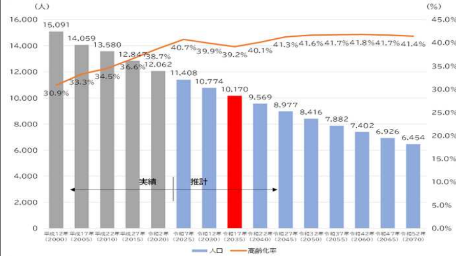
表 1-1 (2) 人口の見通し (鏡野町第3次総合計画)