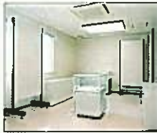
企画展示コーナー