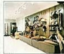
民俗資料展示コーナー