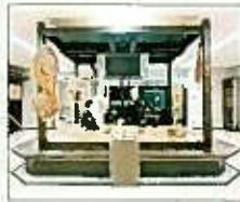
語り部展示コーナー