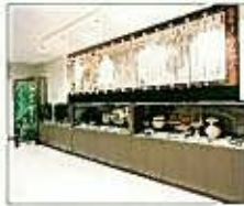
遺物展示コーナー(歴史年表)