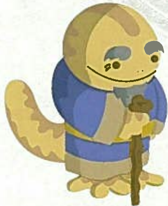
奥津歴史資料館イメージキャラクター オオサンショウじいさん

奥津をはじめその周辺の歴史や文化に関するビデオ・図書を自由に閲覧することができます。新たな歴史の1ページを探してみてください。