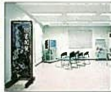
図書閲覧コーナー

※資料中の「奥津町」は、平成17年3月に合併し、現在は「鏡野町」となっています。