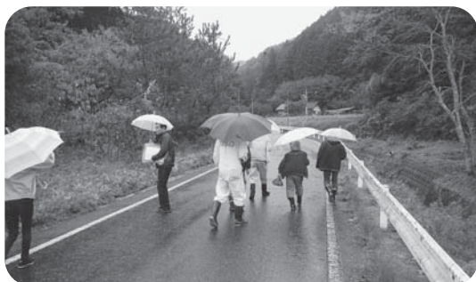
まち歩きにより危険箇所の確認を行います