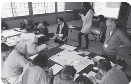
避難経路などを地図に書き込みます