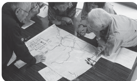
意見を出し合いながら防災マップを作成します