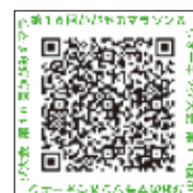
▲コース (Google map)