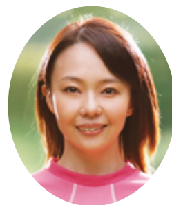
ゲストランナー 千葉真子さん

参加料：高校生以下……………2,000円 一般 (3km) ……………3,000円 (10km) ……………4,000円 (ハーフ) ……………5,000円 フレンズ&ファミリー (1組3名迄) ……………4,000円 ウォーキング……………500円