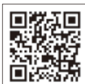
▲鏡野町ホームページ