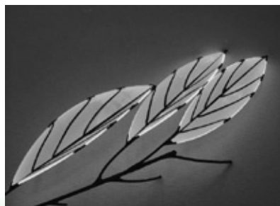
葉っぱをイメージした作品