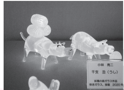
令和3年の干支「丑(うし)」