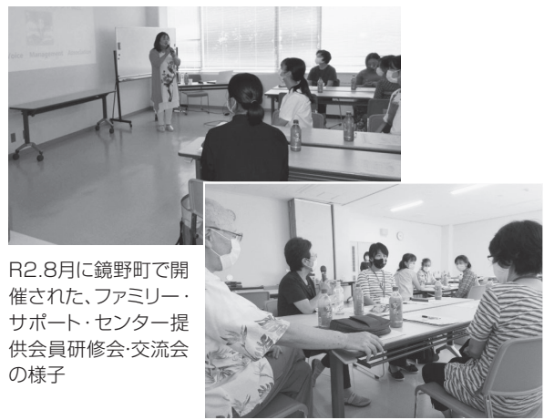
R2.8月に鏡野町で開催された、ファミリー・サポート・センター提供会員研修会・交流会の様子

活動の前には、アドバイザーも立ち会い、会員さん同士の顔合わせを津山ファミリー・サポート・センターで行います。