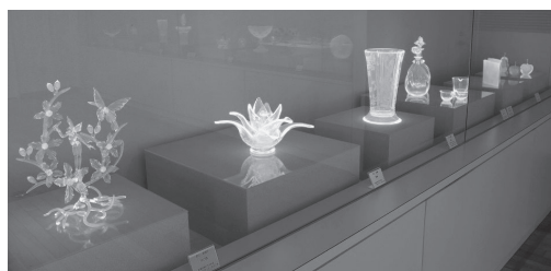
紫外線で光らせて展示している。