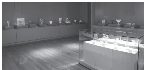
以前開催した収蔵作品展の展示会場

前半会期：7月8日(水)～10月5日(月) 後半会期：12月23日(水)～令和3年3月22日(月)