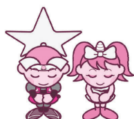
岡山県マスコット ももち・うらっち

新型コロナウイルスによる感染症について不安なことがある場合は、相談窓口にご連絡してください。