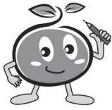
キャラクターの つっちーくん