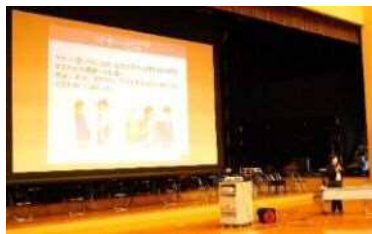
笑顔でコミュニケーション

事業所や店舗などの就労体験はもちろん、事前に電話をかけたり、お礼の手紙を書いたりすることで、社会の一員としてのマンナー・礼儀の大切さを知ることができました。生徒達にとって、貴重な経験になったと思います。各事業所の皆様には、きめ細かい気配りや対応をさせていただき有り難うございました。