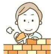
家族を養うために レンガを積んでるんだよ