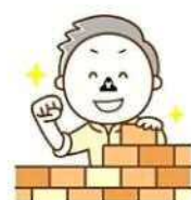
歴史に残る大聖堂を 造ってるんだよ