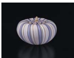
ヴェニス水指 1997年頃