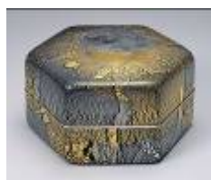
飾篋 琳派 1996年頃